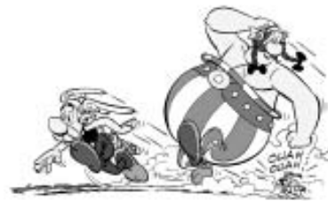
Astèrix i Obèlix